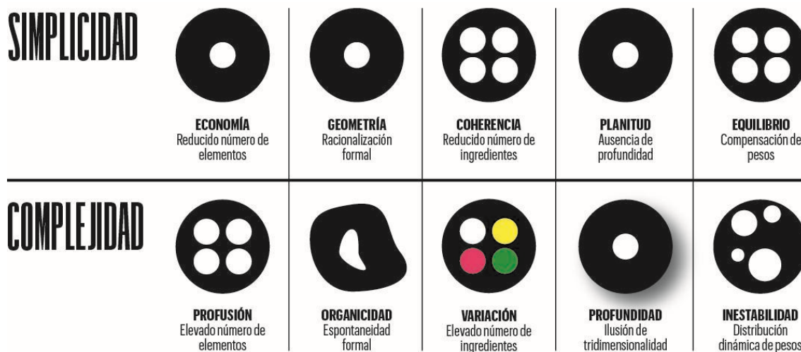
Figura 1. Variables definitorias de la simplicidad y complejidad.