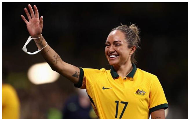
Figura 2. Segunda imagen de The Telegraph