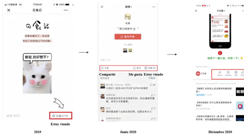
Imagen 3. Cambios de la forma de interacción en los artículos en 2020.