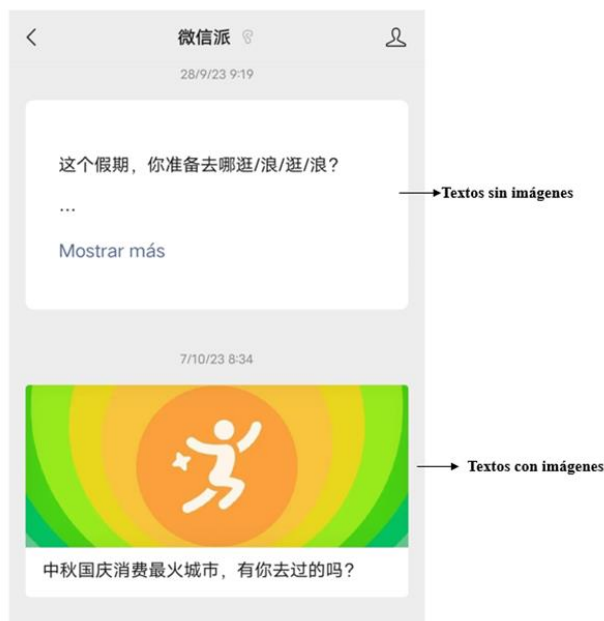
Imagen 1. Dos formatos principales de textos en las «cuentas oficiales».

al otorgar una oportunidad para que todas las personas, no solo para las empresas, pudieran difundir sus textos en la aplicación. Desde el lanzamiento de esta función, numerosas personas y organizaciones se apresuraron a crear sus propias «cuentas oficiales» en WeChat. Los textos en las «cuentas oficiales» se presentaban principalmente en dos formas, como se muestra en la imagen 1: texto corto sin imágenes, con un máximo de 300 palabras y sin posibilidad de interacción, y texto largo con imágenes, con un mínimo de 300 palabras y sin límite de extensión. En ambos formatos se prohibía poner el enlace exterior. Como se muestra en esta imagen, los textos largos con imágenes tenían portada y título, mientras que los textos sin imágenes carecían de esta posibilidad. Por ello, la forma de texto largo con imágenes era la forma principal en la difusión de información.