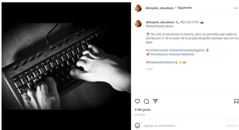
Figura 4. Ejemplo de supracapacidad en los pies.