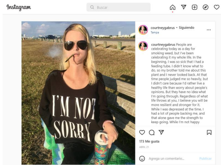
Figura 6. Ejemplo de rebeldía.