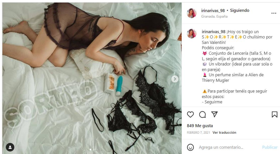
Figura 2. Ejemplo de sexualidad.