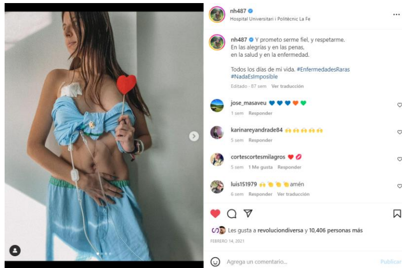
Figura 7. Ejemplo de orgullo.

Esto último, de hecho, redonda ya no solo en el orgullo, sino en el radical self-love , que para Kafai (2021) es «indeed our inherent natural state, but social, political, and economic systems of oppression have distanced us from that knowing» (p.36), por lo que, publicaciones como la del ejemplo, una vez más, no solo visibilizan este hecho de forma externa, sino que al propio colectivo le hace comprender que aceptarse y quererse a sí mismo es algo natural a lo que tienen derecho.