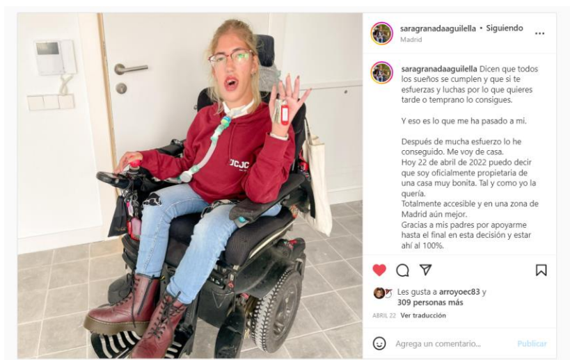
Figura 1. Ejemplo de emancipación.