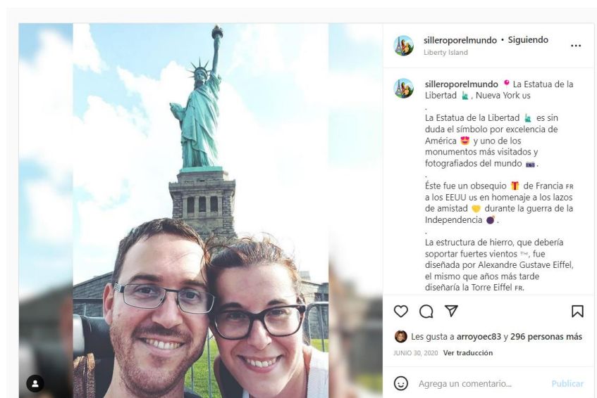
Figura 3. Ejemplo de felicidad.