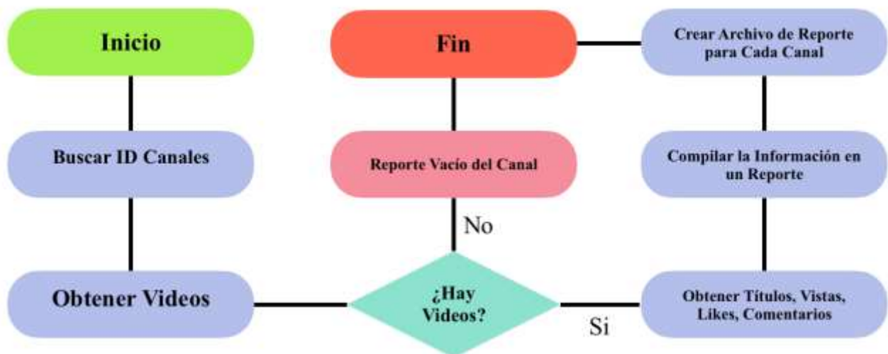
Figura 1. Proceso de Recopilación de Información

Se realizó la búsqueda y selección de canales de YouTube específicamente relacionados con la Inteligencia Artificial. Posteriormente, se realiza la obtención de los identificadores de canal, seguido de la extracción de videos de cada uno (Li et al., 2024). La decisión de si hay contenido disponible en el canal conduce a dos rutas: la recolección de identificadores de videos, títulos, visualizaciones, «me gusta» y comentarios, o la creación de un reporte vacío en caso de ausencia de videos (Srikumar & Srikumar, 2021). La información recolectada se compila entonces en un reporte, y se crea un archivo para cada canal, concluyendo así la fase de recopilación de datos del estudio como se muestra en la figura 1.