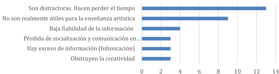
Figura 2. Aspectos negativos del uso de redes sociales percibidos por el estudiantado en el ámbito formativo de la Carrera de Artes Visuales de la Universidad de Cuenca.

En lo que atañe a los aspectos negativos de la utilización de redes sociales en el contexto de la Carrera de Artes Visuales, los estudiantes destacaron, en primer lugar, el hecho de ser distractoras. Se subrayó también la percepción de que las redes sociales no son verdaderamente útiles para los procesos de enseñanza artística, y un punto relevante a destacar es la baja confiabilidad que puede atribuirse a la información que difunden. En total, fueron 6 las categorías de respuesta consignadas (Figura 2).