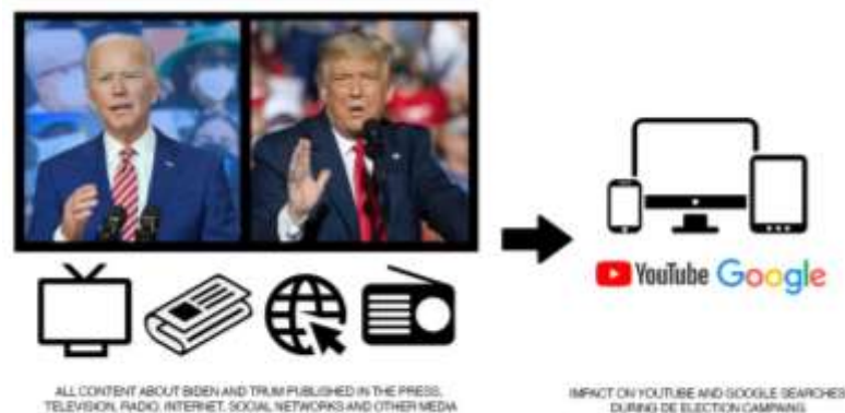
Figura 1. Método utilizado para el análisis

Fuente: Elaboración propia. Esquema que ejemplifica el método utilizado para analizar el impacto de las búsquedas de "Trump" y "Biden" en Google y YouTube durante la campaña electoral estadounidense. Fuente: Elaboración propia.