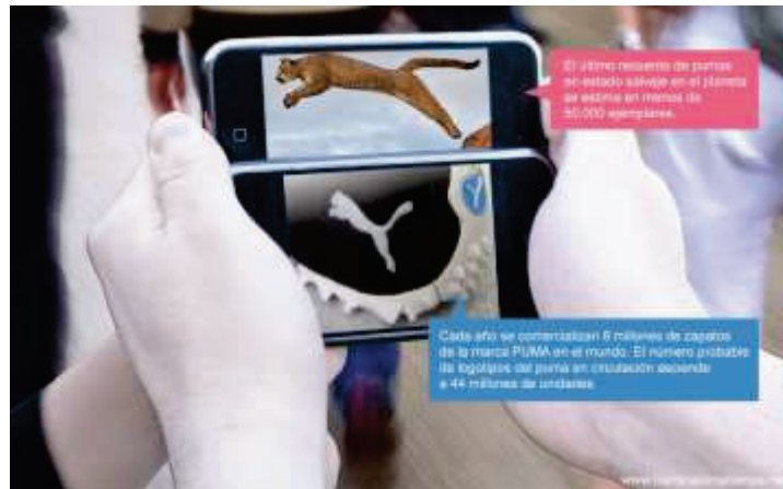
Figura 3. Safari Urbis