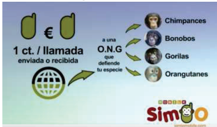
Figura 2. Simiomobile