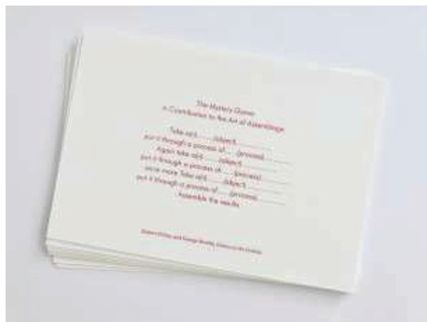
Figura 4. Postal del M HKA que recoge uno de los juegos propuestos por Filliou y Brecht en el seno de La Cédille qui Sourit