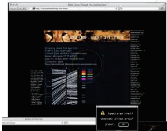
Figura 5. Novus Extinctus