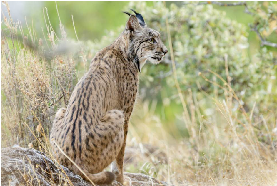
Figura 5: Un lince ibérico retratado en el Parque Natural Sierra de Andújar, de Vicente Laguna.

Fuente: https://elviajero.elpais.com/elviajero/2020/02/13/actualidad/1581587477_576507.html