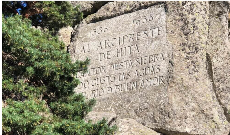
Figura1: Grabado en roca de la conmemoración del monumento.