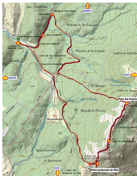
Figura 2: Mapa de la ruta del itinerario circular. Senderismo Peñas Arcipreste de Hita.