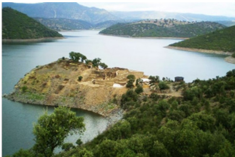
Figura 6: Panorámica del Parque Natural Sierra de Andújar.