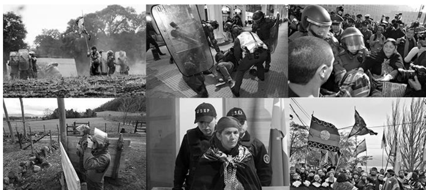
Figura 1. Algunas Imágenes Presentadas al Grupo de Estudiantes

Fuente(s): Sitio web EMOL www.emol.cl y sitio web MAPUEXPRESS www.mapuexpress.cl , elaboración propia, 2021.