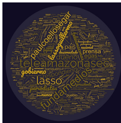
Figura 4. Nube de palabras de abril 2022