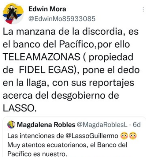
Figura 1. Opinión que relaciona a Teleamazonas con Fidel Egas

En ese contexto, inevitablemente, la opinión pública -manifestada en su mayoría en redes sociales- vincula, por lo general, a Fidel Egas con Teleamazonas. Es por eso que, en los meses de abril y mayo de 2022, cuando Teleamazonas comenzó a sacar una serie de reportajes que pusieron al desnudo la grave crisis económica e institucional que sufre el sector público del país, en Twitter hubo manifestaciones que indicaban un nuevo pleito entre Lasso y Egas.