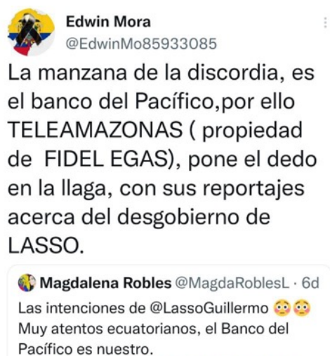
Figura 1. Opinión que relaciona a Teleamazonas con Fidel Egas

En ese contexto, inevitablemente, la opinión pública -manifestada en su mayoría en redes sociales- vincula, por lo general, a Fidel Egas con Teleamazonas. Es por eso que, en los meses de abril y mayo de 2022, cuando Teleamazonas comenzó a sacar una serie de reportajes que pusieron al desnudo la grave crisis económica e institucional que sufre el sector público del país, en Twitter hubo manifestaciones que indicaban un nuevo pleito entre Lasso y Egas.