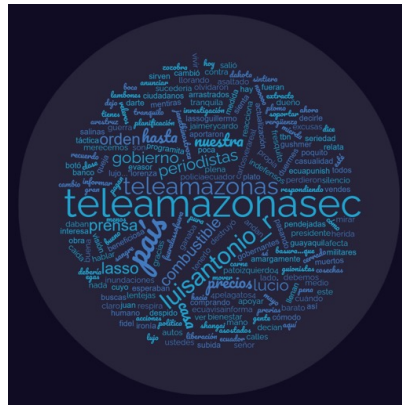
Figura 5. Nube de palabras de mayo 2022