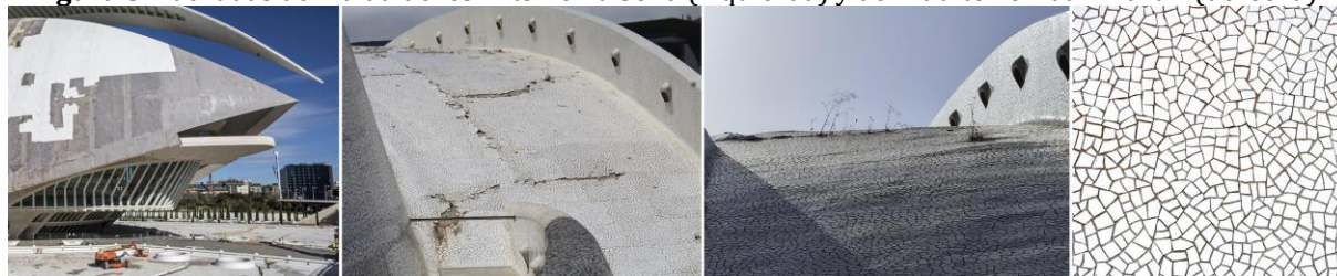
Figura 5. Fachadas del Palau de les Arts Reina Sofia (izquierda) y del Auditorio Adán Martín (derecha).