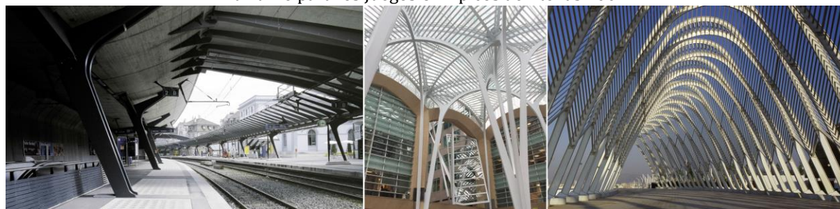
Figura 6. Izquierda: Stadelhofen, Zúrich. Centro: Allen Lambert Galleria, Toronto. Derecha: paseo marítimo para los Juegos Olímpicos de Atenas 2004.

Dicho esto, la traducción técnica del trencadís reveló límites y lecciones. En enero de 2014, tras desprendimientos en la piel exterior, la Generalitat Valenciana cerró temporalmente el edificio y decidió retirar los 8.000 m 2 de mosaico, ya que el 60 % de la superficie se había desprendido (El País, 2014). Los informes atribuyeron el fallo a una incompatibilidad y a una ejecución deficiente del sistema de fijación sobre un sustrato metálico curvo, con diferencias de dilatación térmica entre la cerámica y la chapa metálica que provocaron abombamientos. El mismo caso se produjo posteriormente en el Auditorio Adán Martín (Moreno, 2017); en ambos casos se documentó una falta de adhesivo y unas condiciones inadecuadas en la obra (Cardellicchio y Tombesi, 2021; Castro et al., 2023). El contraste con Gaudí resulta instructivo: el trencadís de Gaudí, colocado sobre mampostería mineral y superficies con un menor gradiente térmico, ha demostrado una notable durabilidad cuando se respetan las técnicas tradicionales y los sustratos adecuados. Así, la comparación no solo pone de manifiesto las afinidades formales, sino que también ofrece, por contraste, las limitaciones fisicoquímicas y los detalles constructivos de cada solución (Figura 6).