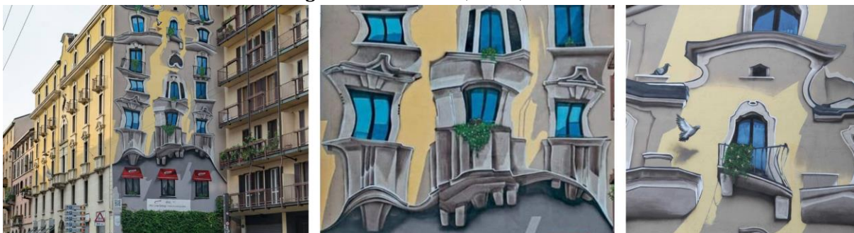
Figura 10. The Vision, Milán, 2021.