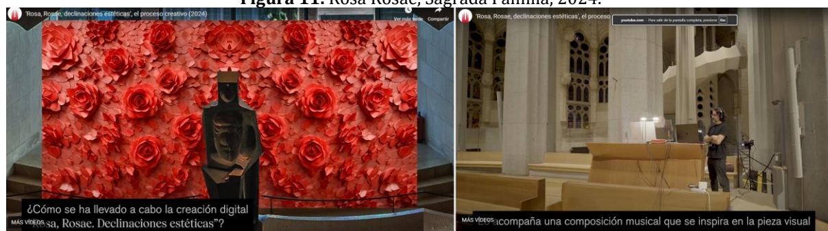
Figura 11. Rosa Rosae, Sagrada Familia, 2024.