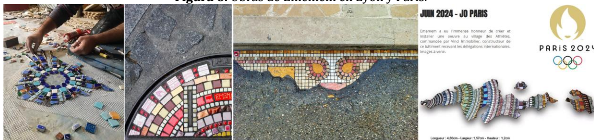
Figura 8. Obras de Ememem en Lyon y París.