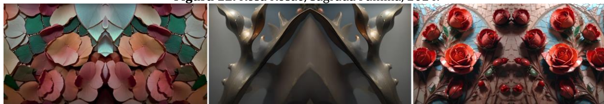
Figura 12. Rosa Rosae, Sagrada Familia, 2024.