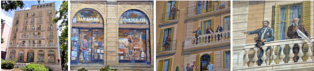
Figura 9. Mural «Balcones de Barcelona», 1992.