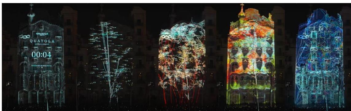
Figure 13. Quayola, Casa Batlló, 2025