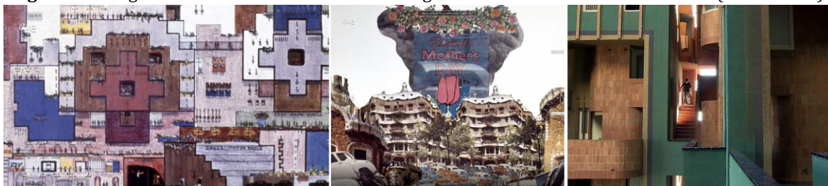
Figura 4. Collages de Bofill con obras de Gaudí e imagen del interior del edificio Walden 7 (a la derecha).