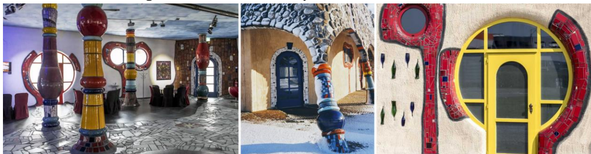
Figura 2. Markethall. Interior y detalles. 1998–2001. Suiza.

Así, la oposición de Hundertwasser a la línea recta y la curvatura estructural de Gaudí convergen en una crítica al mecanicismo y una defensa de la corporeidad de la vivienda (Hundertwasser, 1985; 1991).