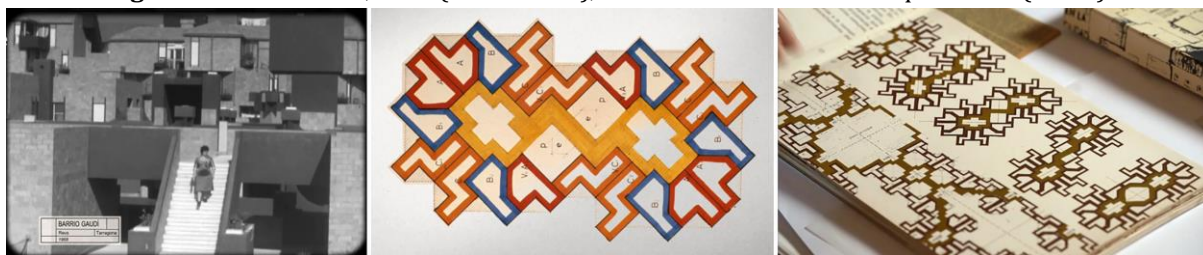
Figura 3. Barrio Gaudí, Reus (1964–1968), Ricardo Bofill Taller de Arquitectura (RBTA).