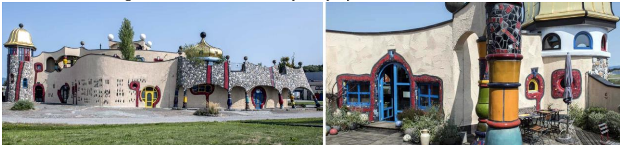
Figura 1. Markethall. Fachada principal y terraza. 1998-2001. Suiza.