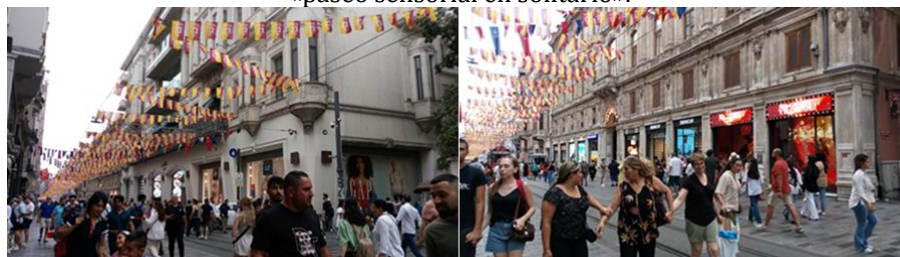
Figura 7. Las imágenes muestran dos khans históricos. La foto de la izquierda muestra Istiklal Avm y la de la derecha revela el edificio Grand Pera; ambas fueron tomadas en julio de 2023 durante un estudio de «paseo sensorial en solitario».

Las experiencias multisensoriales están arraigadas en el lugar porque se proporcionan prestaciones urbanas a los habitantes (Richardson, 2012; Bachelard, 2014). Las personas perciben y descodifican sus roles, expectativas y motivaciones a través de experiencias sensoriales. El interior urbano contiene mensajes y significados multisensoriales (Rapoport, 1990). Las interacciones entre el tiempo y las experiencias corporales generan condiciones sociales a través de encuentros sensoriales (Harvey, 2006; Massey, 2008). La plaza Taksim y la calle Istiklal promueven eficazmente la diversidad social, que es parte integral de la vida urbana de Estambul. El lugar es un interior urbano cosmopolita, moldeado por las contribuciones de inmigrantes, minorías, la burguesía y artistas de diversos orígenes. El interior urbano refleja la compleja evolución sociocultural de Estambul. Las fachadas y las impresionantes puertas han conservado las texturas arquitectónicas de finales de la era otomana, aunque fueron sometidas a algunas restauraciones y renovaciones durante el período de la República de Turquía. Los edificios históricos, como las casas de té y las cafeterías literarias, dominaban el ambiente social. Los pasajes históricos, los patios y los khans han dado forma a la imagen visual única de la zona (véase la figura 7).