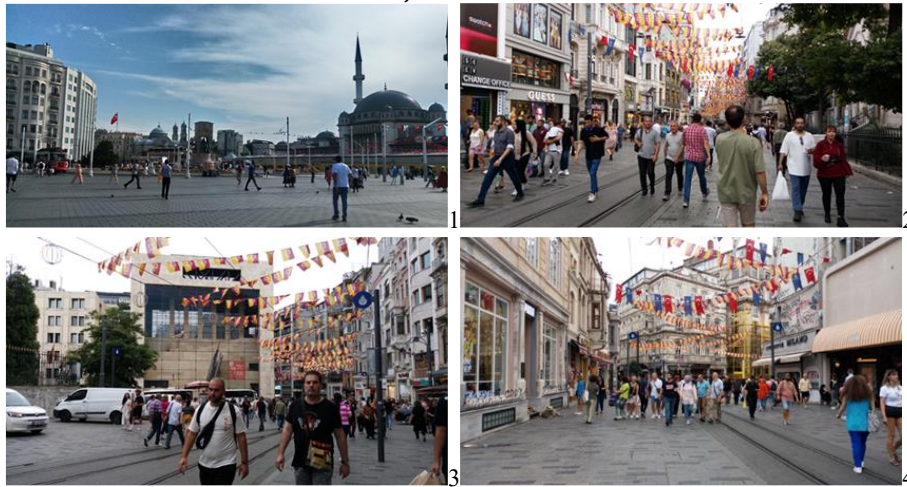
Figura 2. La primera foto muestra la plaza Taksim, con la iglesia de Hagia Triada y la recién construida mezquita de Taksim. La segunda foto muestra a personas caminando por la calle Istiklal durante el día. La tercera imagen muestra el Centro Cultural Yapi Kredi en la plaza de Galatasaray. La última foto muestra la plaza Tunnel. Las fotos fueron tomadas en julio de 2023 durante el estudio «solo senswalking ».