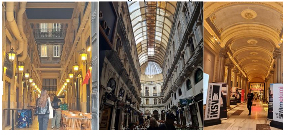
Figura 6. Los estrechos pasillos y patios de la zona. Las fotos fueron tomadas en octubre de 2023 durante el estudio «group sensewalking».

urbano presenta una amplia gama de atmósferas. Las siguientes imágenes nos muestran los espacios interiores de los pasajes largos y sombríos de la zona. Las superficies interiores ornamentadas, los patrones y los materiales de construcción revelan las ricas identidades hápticas del interior urbano (véase la figura 6).