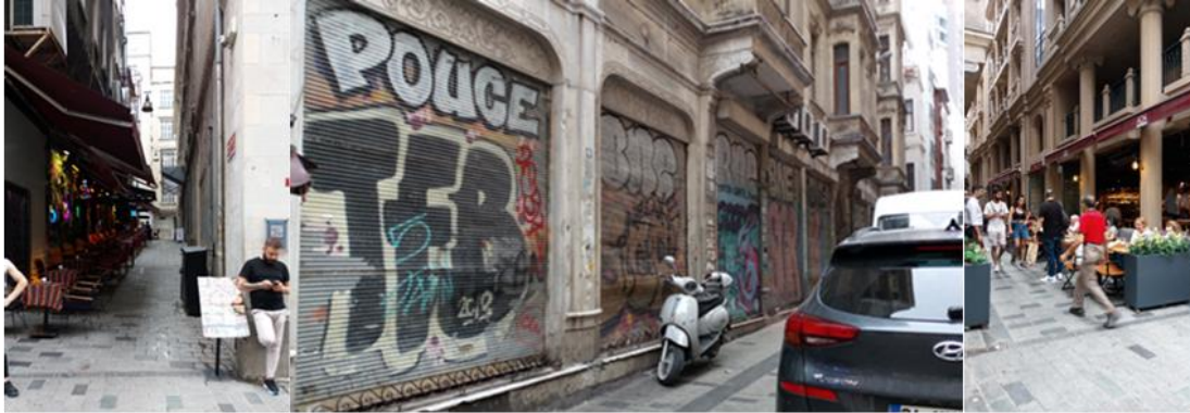
Figura 10. La figura muestra las calles laterales de la zona. Las coloridas paredes con grafitis y las pequeñas cafeterías animan las calles laterales; las fotos se tomaron durante los estudios «solo sensewalking » y «group sensewalking ».