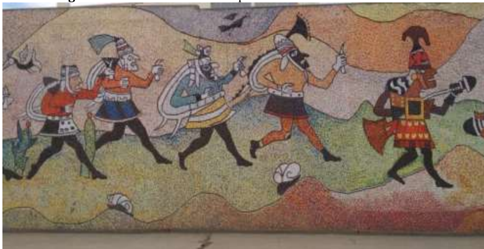
Figura 3. Guerreros mochicas representados en la Huaca de la Luna.

Fuente. Fotografía de los autores, 2024 (sección de la Pinacoteca).