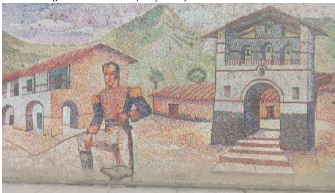
Figura 1. Sánchez Carrión, campanario y casa de arcos de Huamachuco.