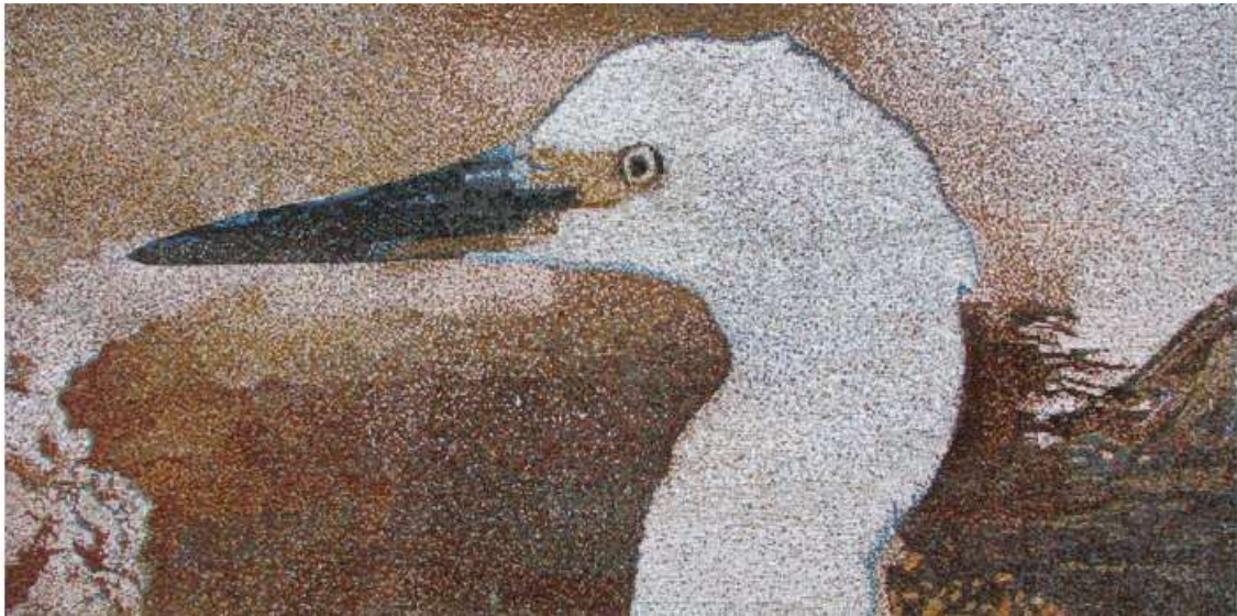
Figura 2. Cabeza gigante de un ave de tiempos inmemoriales.