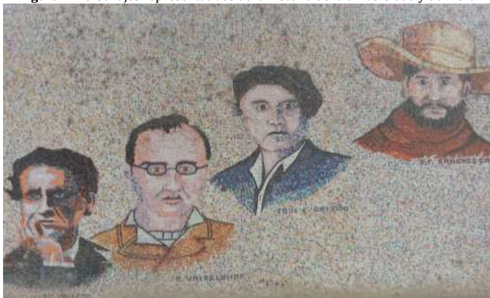
Figura 4. Personajes representativos de la historia de la universidad y del Perú.