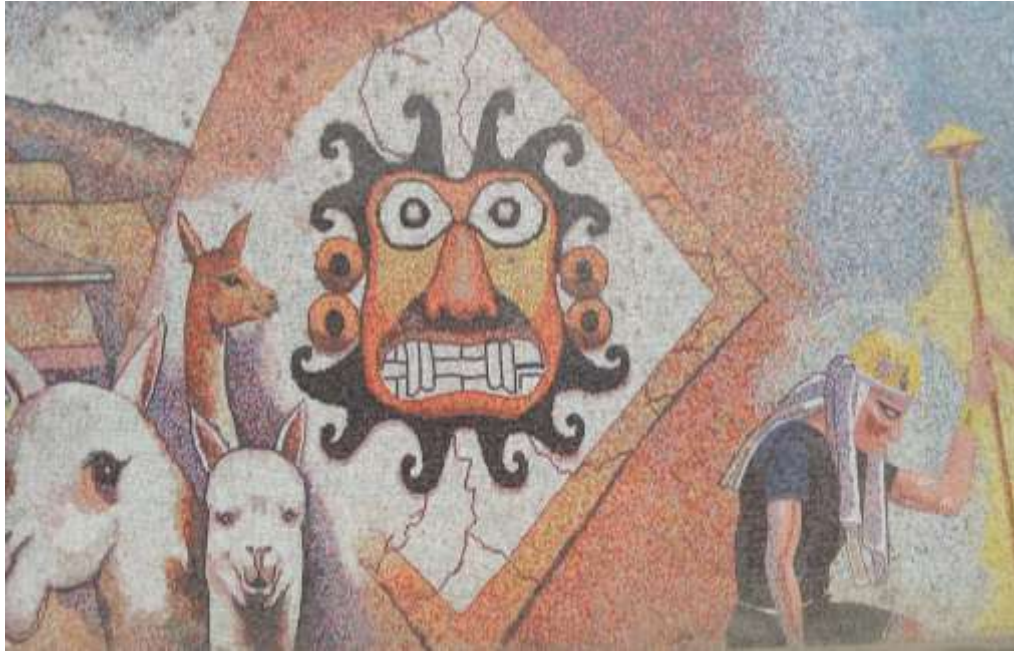
Figura 5. El dios Aipaec o Degollador, la deidad de la cultura Moche.