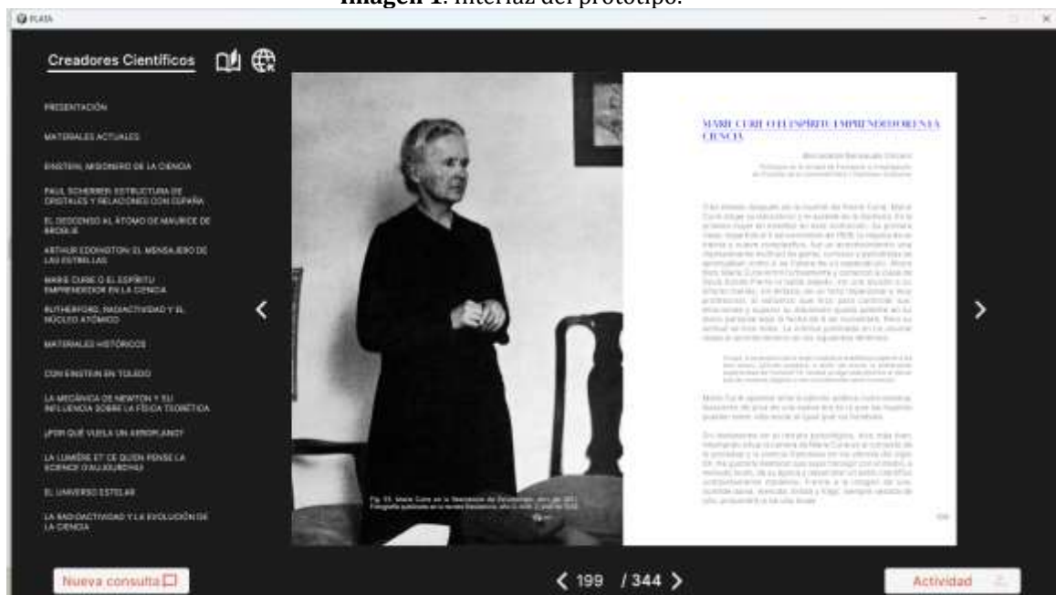
Fuente: Prototipo PLATA sobre Creadores Científicos. La física en la Residencia de Estudiantes [1910-1936] (2013), VV. AA.

Una vez nos encontramos en el capítulo que queremos trabajar, se accede a la actividad didáctica sugerida por el prototipo. En este caso, se muestra la actividad tal y como aparece al usuario profesor, ya que es el modo en que es posible acceder a toda la información. A saber: descripción de la actividad, enunciado y nota pedagógica. En el caso del alumnado, obtendría de forma emergente únicamente el enunciado.