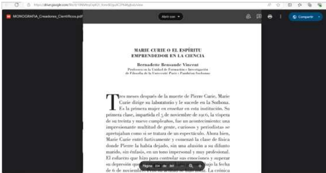
Fuente: Prototipo PLATA sobre Creadores Científicos. La física en la Residencia de Estudiantes [19010-1936] (2013), VV. AA.

El siguiente paso en la actividad propuesta exige acceder a los archivos de la Residencia de Estudiantes. El acceso es posible desde el libro, que está conectado a través de una API a los archivos digitales localizados en los servidores de la Residencia. En este caso, accedemos al video de la conferencia Marie Curie ou l'esprit d'entreprise en science . En la ficha que presenta la conferencia, es posible consultar la fecha, la conferenciante y el ciclo al que pertenece. De este modo, se facilita la búsqueda en el archivo de nuevos materiales si se quiere continuar una labor investigadora más allá de esta actividad concreta.