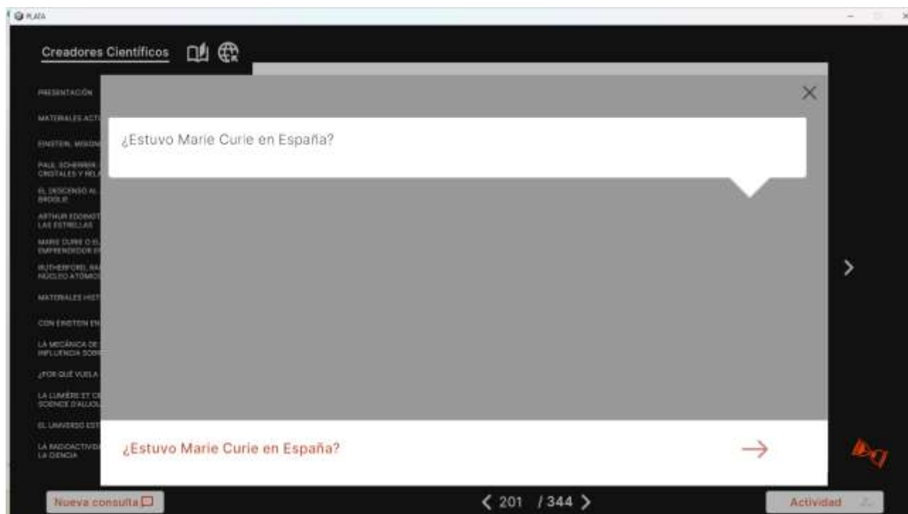
Imagen 6. Formulario de consultas a la inteligencia artificial.