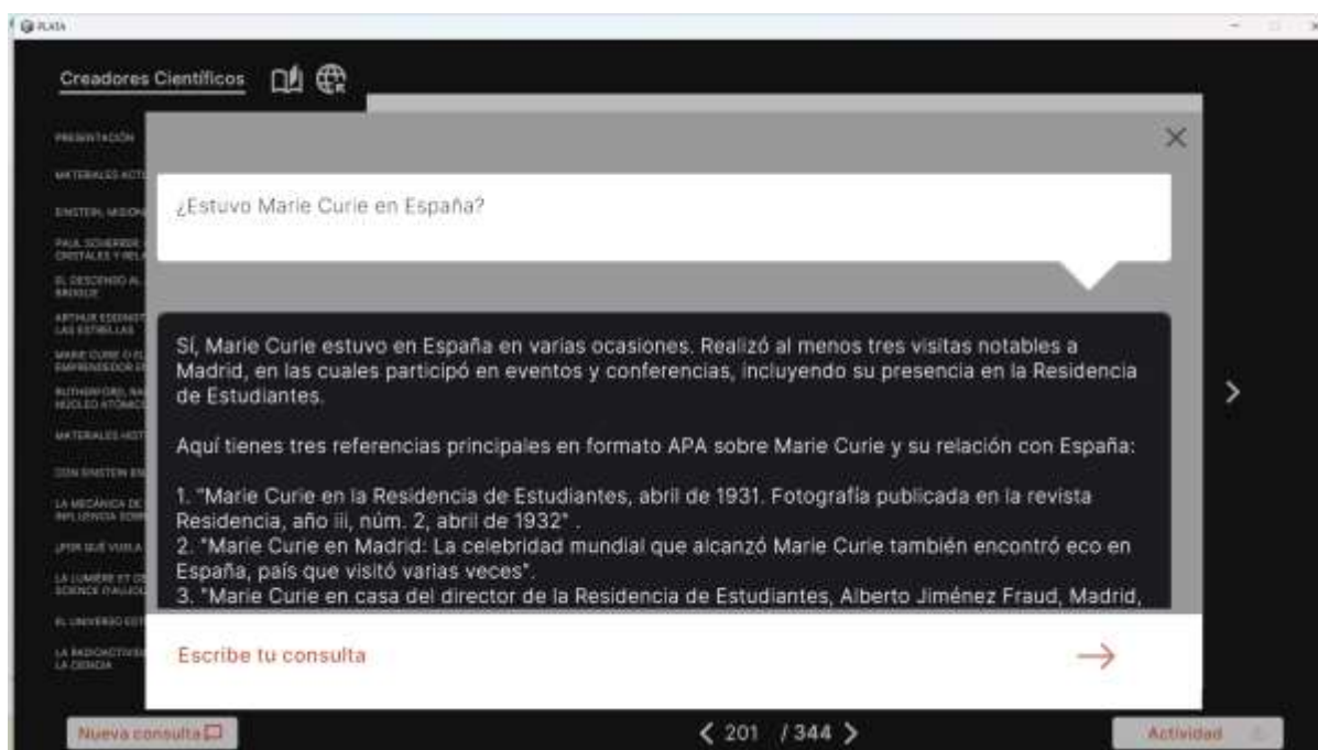
Imagen 7. Respuesta ofrecida por la inteligencia artificial.