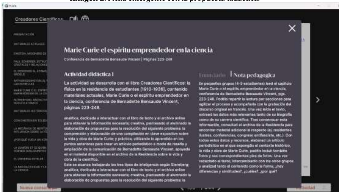
Fuente: Prototipo PLATA sobre Creadores Científicos. La física en la Residencia de Estudiantes [1910-1936] (2013), VV. AA.

En la primera parte de la actividad «Marie Curie: el espíritu emprendedor de la ciencia», el alumnado debe leer unas páginas indicadas. Estas páginas pueden leerse tanto en el entorno interactivo del prototipo o, si es necesario para facilitar la lectura, en el PDF, al que siempre se debe tener acceso desde el menú para evitar problemas de accesibilidad, facilitando los criterios de diseño universal recogidos en la LOMLOE (BOE, 2020)