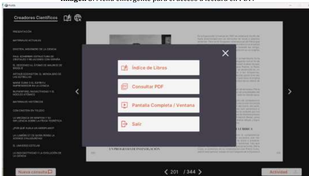
Fuente: Prototipo PLATA Creadores Científicos. La física en la Residencia de Estudiantes [1910-1936] (2013), VV. AA.