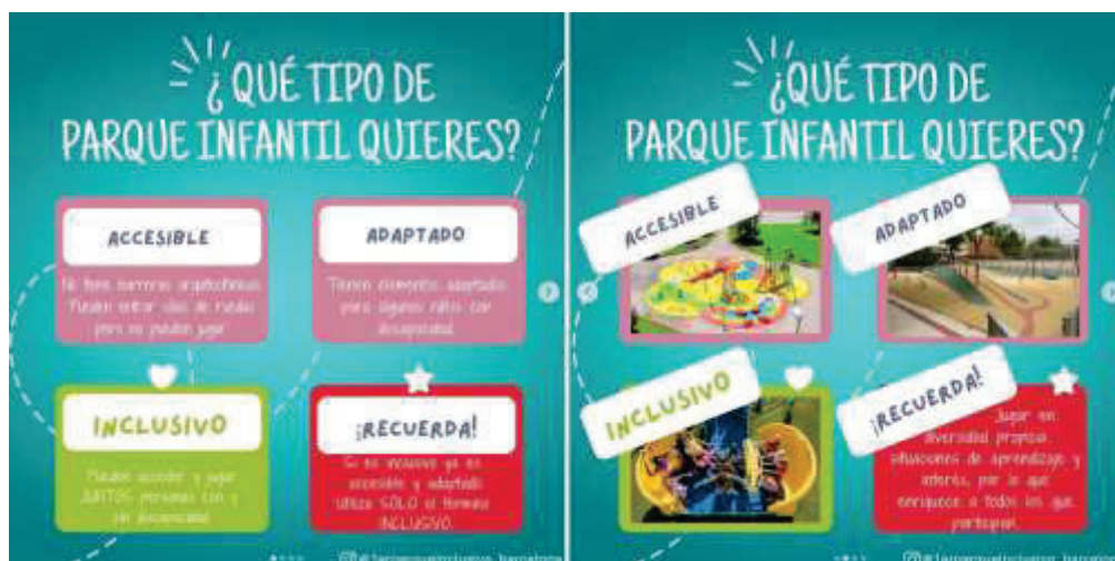
Figura 2. Tipos de parques infantiles