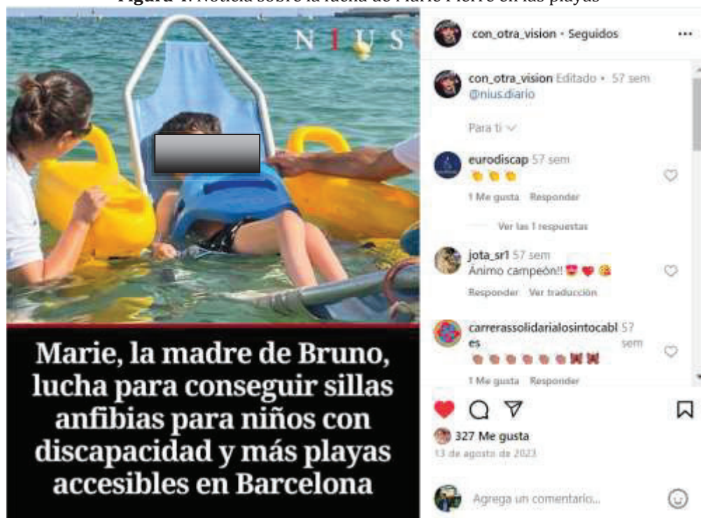
Figura 4. Noticia sobre la lucha de Marie Pierre en las playas