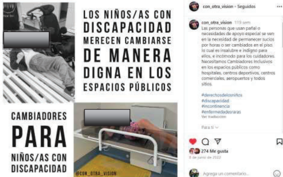
Figura 7. Publicación exigiendo cambiadores inclusivos