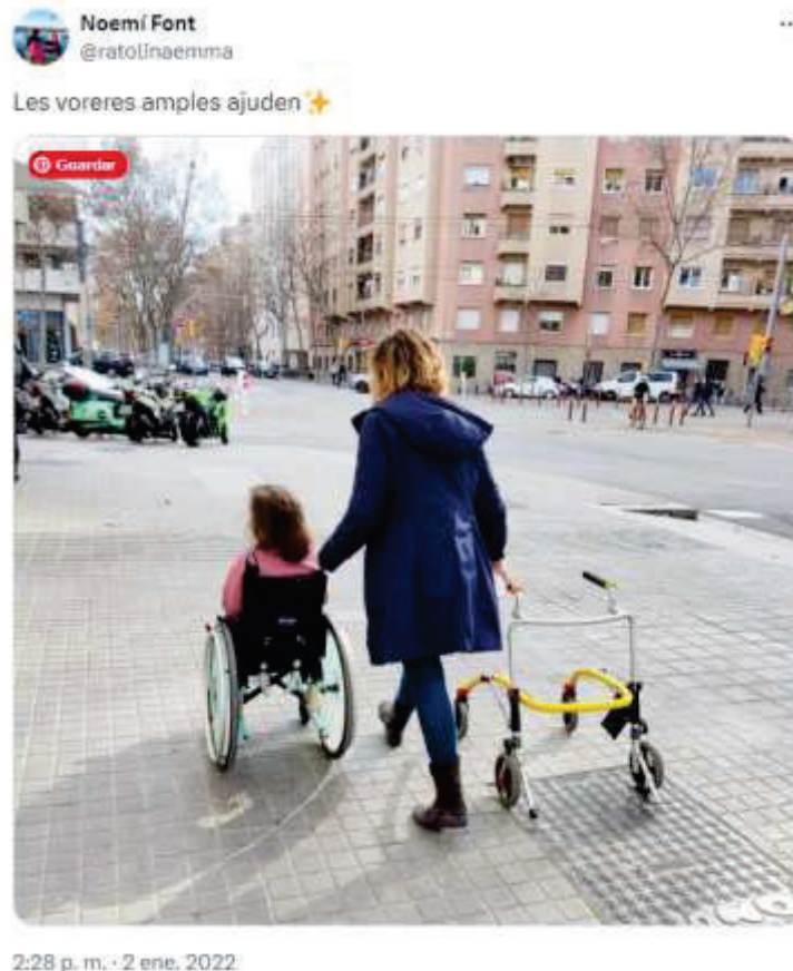
Figura 11. Tuit agradeciendo las aceras anchas