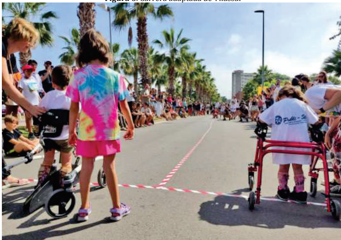
Figura 6. Carrera adaptada de Vilassar