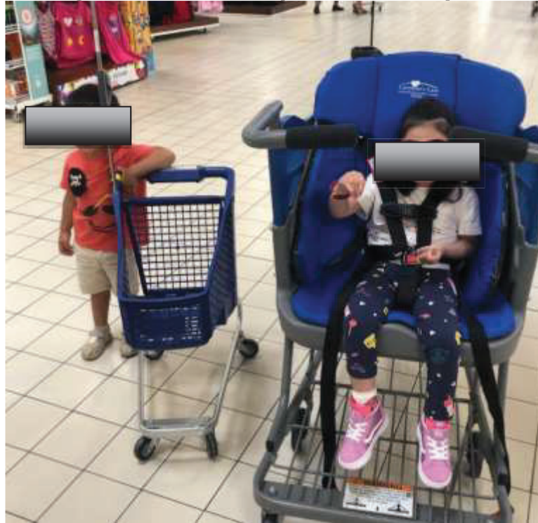
Figura 10. Haciendo la compra con un carro adaptado