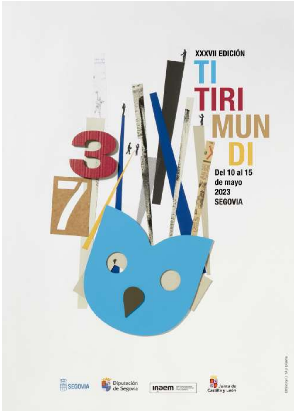
Figura 7: cartel Titirimundi 2023

Este cartel ha sido realizado por Emilio Gil. Utiliza como concepto el títere y la expresión de la marioneta como eje dinámico, da importancia a las personas: espectador y titiriteo dentro del festival y así del cartel. Simula la ciudad y su ambiente.