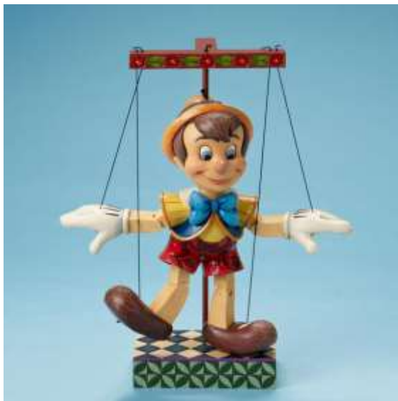
Figura 1. Ejemplo de marioneta

Marioneta: Figura creada que se manipula con hilo, principalmente desde la parte superior. Los hilos se colocan sobre la parte que desea mover y es quien crea cada personaje quien decide los movimientos que este debe tener para interpretar lo que dese de él. Piezas creativas, normalmente únicas que inventa quien interpreta el número.