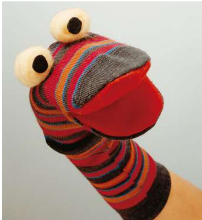
Figura 3. Imagen de títere de guante

Títere de guante: Este muñeco es quien da nombre a los títeres. Es el más sencillo en su creación y simplemente se manipula con su cabeza. Se caracteriza por la capacidad de mover su boca. La mano se introduce en el títere como si fuera un guante, siendo el dedo pulgar el que normalmente mueve la mandíbula inferior y el resto de los dedos la mandíbula superior. Este títere se ofrece normalmente en tiendas de juguetes permitiendo que la cultura del títere llegue a los hogares con mayor facilidad.