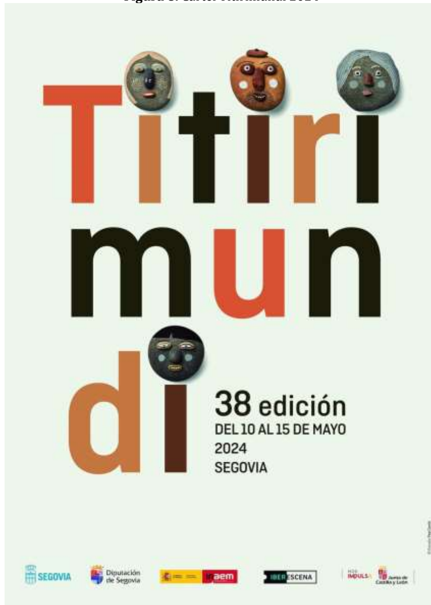
Figura 8. Cartel Titirimundi 2024

Este cartel es del año 2024, creado por el autor Pep Carrió.