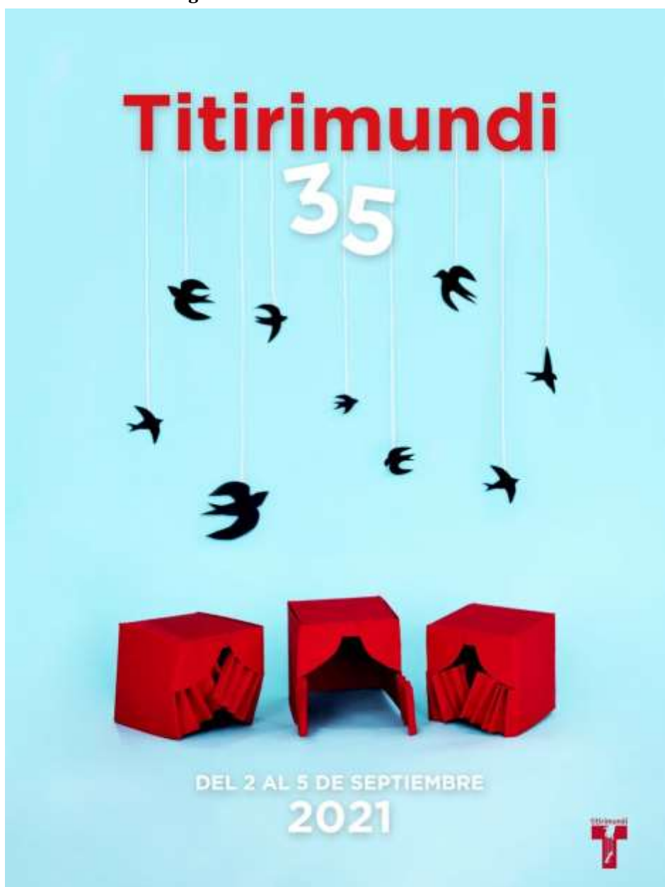
Figura 5. Cartel del Titirimundi año 2021