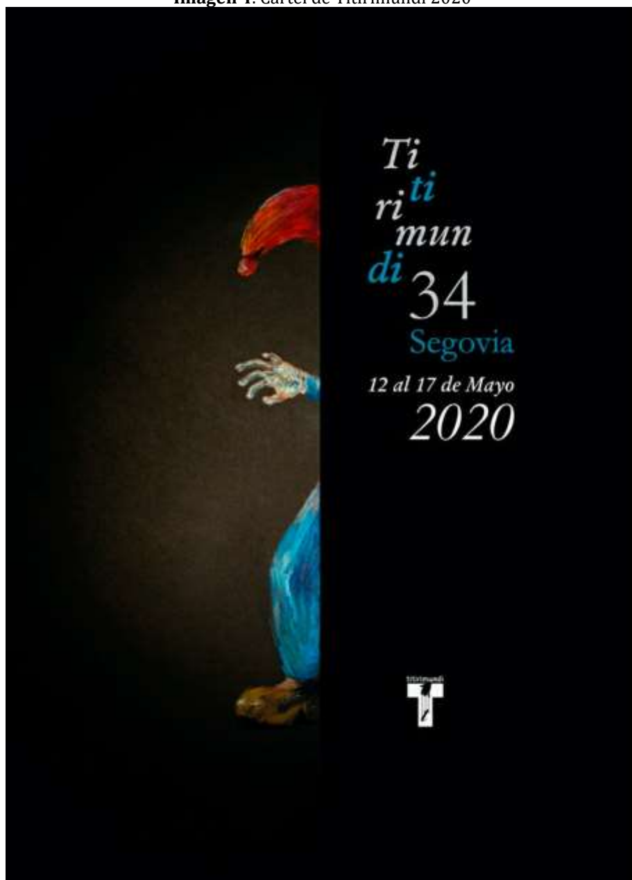
Imagen 4. Cartel de Titirimundi 2020

La información que se les da es simplemente el conocimiento del festival, su antigüedad y sus fines. Todo cuanto se comunica desde su web, con la única condición de que ponga el nombre del festival, edición, fecha concreta, y logotipo de las entidades participantes si es necesario. Nos indica también su directora el concepto que expresa cada cartel según lo que manifestó cada artista.