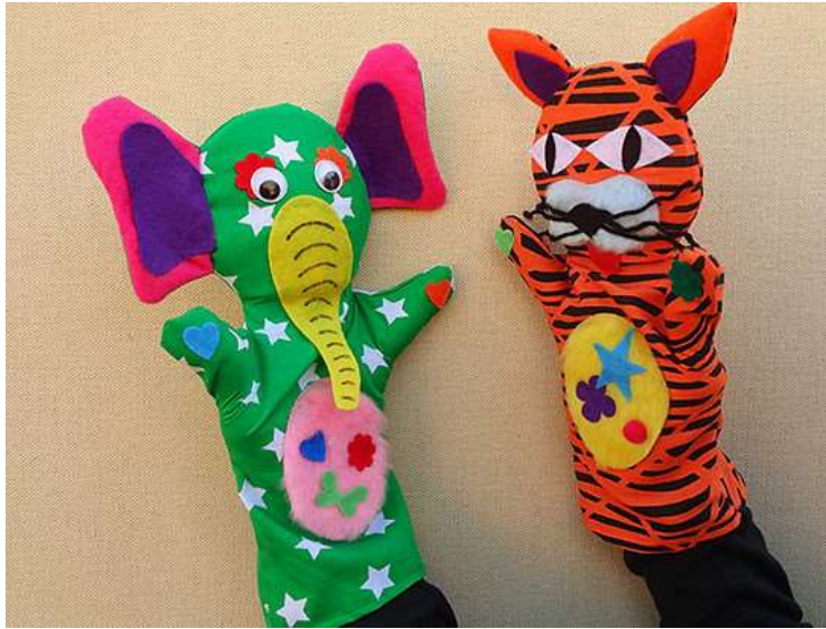
Figura 2: Imagen de Guiñol